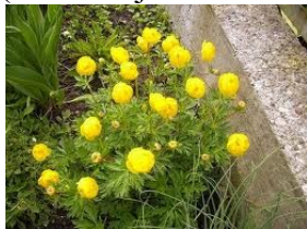
39. Pełnik chiński ( Trollius chinensis )