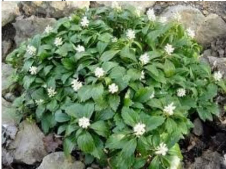
1. Runianka ( Pachysandra terminalis ) białe (lokalizacja - Wrocław - ROD „Pokój”)