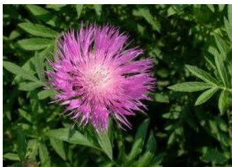
36. Chaber górski ( Centaurea montana ) niebieskie z fioletowymi środkami, 'Grandiflora', 'Violetta' (ciemnofioletowe) (lokalizacja - Wrocław - ROD „Pokój”)